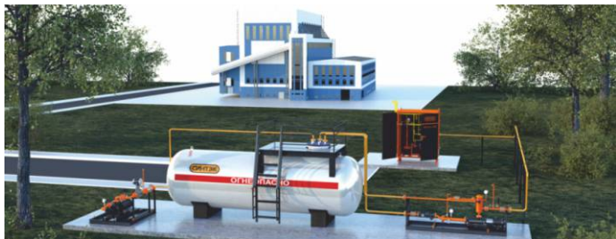
Данная компоновочная схема системы автономного газоснабжения является приблизительной и приведена в качестве наглядного примера