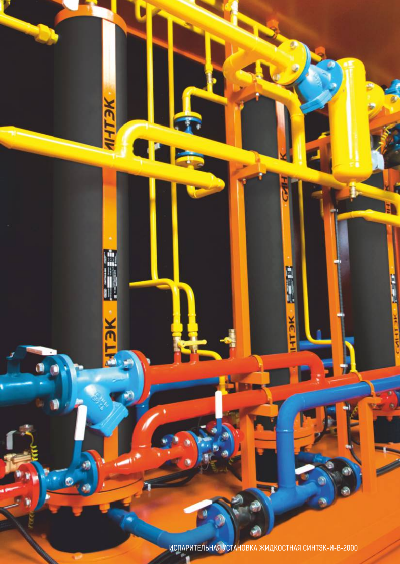
ИСПАРИТЕЛЬНАЯ УСТАНОВКА ЖИДКОСТНАЯ СИНТЭК-И-В-2000